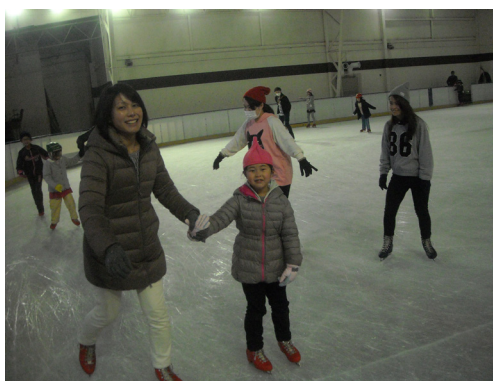
▲スケート体験の様子