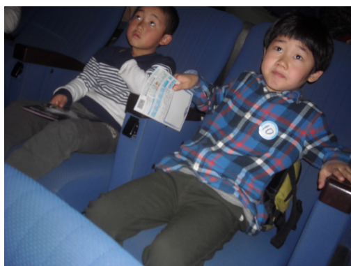
▲プラネタリウム見学の様子

3月5日（土）、東峰 Jr. みらい塾は児童 17 名、大人 10 名の参加で久留米市の福岡県立青少年科学館へ行きました。プラネタリウムで星座の学習をして、館内見学を楽しみました。昼食を済ませてからは、スケート体験を行いました。東峰学園の遠足もスケートだったので、皆上手に滑っていました。今年度最後のみらい塾でしたので、閉講式を行い皆勤賞の 3 人にはノートがプレゼントされました。Jr. みらい塾は、1・2 年生の参加には保護者の同伴が必要ですが、来年度もたくさんの参加をお待ちしております。