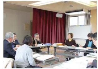
▲協議を行う村長と教育委員

2月15日（月）、第3回東峰村総合教育会議を開催し「平成28年度予算編成」について協議しました。会議では、教育委員会から平成28年度の教育に関する施策と予算、課題や検討事項についての説明があり、これらに対する村長の意見を交えながら協議が進められました。会議を通じて、必要な予算の措置を図りながら村の教育の更なる充実と課題解決に向けて取り組んでいくことが確認されました。