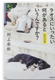
▲『ラオスにいったい何があるというんですか？』 著者：村上 春樹

「めちゃくちゃの面白さ。私たち80年代をこんなにもてあそんでいいのか！この天才野郎！」BRUTUS連載で話題！1989年にタイムスリップしたフリーター（45歳、独身女子）トリコは、憧れのミュージシャンの死を止めることにした。