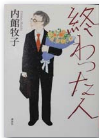
▲『終わった人』 著者：内館 牧子

話題の長編小説！意表を突くストーリー展開！読みだしたら止まらない面白さ。60代は複雑な存在だ。「終わった人」と烙印を押される一方で、本人は失ったものを取り戻したいと思う「空腹の時代」でもある。著者はその男たちの心理をすべて見通したかのように、完膚なきまでに白日のもとに晒す。