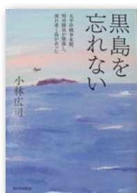
▲『黒島を忘れない』 著者：小林 広司

旅先で何もかもがうまく行ったら、それは旅行じゃない。そこには特別な光があり、特別な風が吹いている。それらの風景はそこにしかなかったものとして、僕の中に立体として今も残っている、これから先も結構鮮やかに残り続けるだろう。