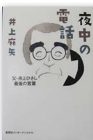
▲『夜中の電話』 著者：井上 麻矢

今よみがえる、思い半ばで不時着した若き軍神たちと、鹿児島沖に浮かぶ「黒島」の人々との深い、深い愛情の記録。自らの命を犠牲にしてまで戦おうとした若者たち、貧しい暮らしの中、必死で兵士を助けた黒島の人たち。悲惨な戦争時代、「命を懸けて」行動した人間の温もりを、今の時代に少しでも伝えることができれば幸いです。