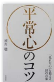
▲『平常心のコツ』 著者：植西 聰

2009年がんで療養中の父から夜中の電話がかかるようになった。井上ひさしが、三女・麻矢に残した言葉は、次の世代を生きる誰もが共感する、最後のメッセージである。