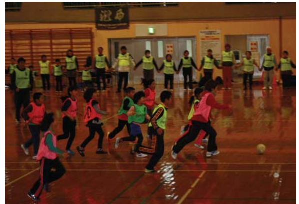
(写真はフォトギャラリーにも掲載しています)

参加者の方からも、「普段、ふれあうことのできない人とふれあうことができました。」「楽しく運動できてとてもよかったです。」など、大好評をいただきました。今後も、このようなイベントを実施して、健康づくりと地域交流の輪を広げていきたいと思っております。今回参加できなかった方も、ぜひ、来年度の各種スポーツ大会や「らぶすぽ東峰」のニュースポーツ教室などに、積極的に参加していただき、スポーツを通して、お子様から高齢者の方まで、世代や地域の垣根を越えて交流を深め、健康で活力ある元気な東峰村をつくっていきましょう!!