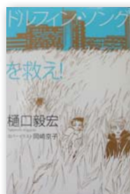
▲『ドルフィン・ソング』 著者：樋口 毅宏

話題の長編小説！意表を突くストーリー展開！読みだしたら止まらない面白さ。60代は複雑な存在だ。「終わった人」と烙印を押される一方で、本人は失ったものを取り戻したいと思う「空腹の時代」でもある。著者はその男たちの心理をすべて見通したかのように、完膚なきまでに白日のもとに晒す。