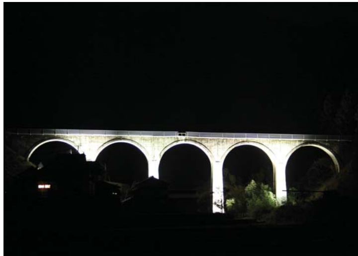
宝珠山橋梁 橋長…79.20m / 径間…14.00m (5連)

めがね橋はJR日田彦山線の大行司駅から筑前岩屋駅の間であり、九州の近代土木遺産にも指定されています。ライトアップされためがね橋を通過する列車は、銀河鉄道を思わせます。期間中、多くのカメラマンが撮影に訪れていました。