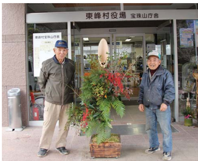
立派な門松ありがとうございます!!