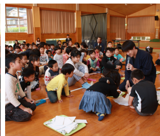
▲東峰学園での交流