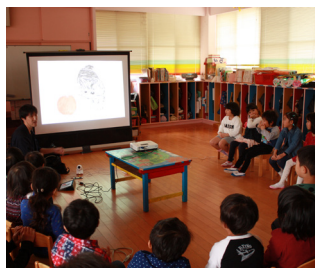
▲小石原保育園での交流