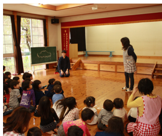
▲美星保育所での交流