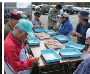
▲クラフト体験の様子