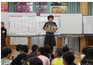
▲一年の活動を振り返りました

福岡県では、“ひまわり”の花言葉「あなただけを見つめる」、「あなたはすばらしい」が『人権』のイメージにあっているという理由などにより人権の花に選ばれています。