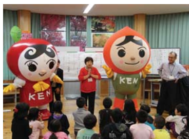
▲人権イメージキャラクター “あゆみちゃん”と“まもるくん”