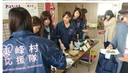
▲販売・PRを行う東峰村応援隊の学生