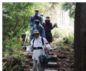
▲ウォーキングの様子