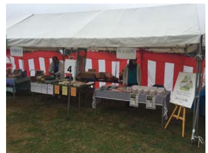
▲連合交流ブースの様子

11月14日(土)、15日(日)の2日間、八女市星野村において八女星のまつりが開催されました。会場には「日本で最も美しい村」連合の交流ブースが設けられ、星野村と同じく連合に加盟している近隣町村の熊本県南小国町と東峰村が出店し、物販やPRを行いました。初日はあいにくの雨でしたが、2日目は天候に恵まれ、会場は、多くの来場者で賑わっていました。