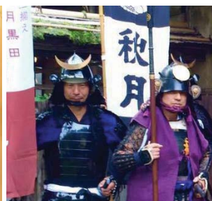
▲秋月鎧揃え保存会の方