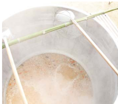
▲具だくさんの千人鍋

11月1日(日)、宝珠山グラウンドにおいて、第11回東峰村秋まつりが開催されました。ステージイベントをはじめ、人気の新米や乾燥シイタケのつかみ取り、千人鍋、黒毛和牛や特産品の販売などが行われ、多くの来場者で賑わっていました。また、同日には秋まつりウォーキングも行われ、320名の参加があり、日田市の大鶴ふるさとまつりと共に秋の味覚を堪能していました。(表紙とフォトギャラリーにも写真を掲載しています。)