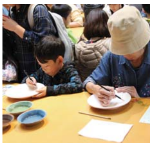
▲絵付け体験の様子