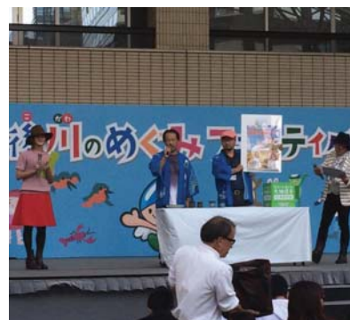
▲ステージでも東峰村をPR

10月24日(土)～25日(日)の2日間、福岡市役所西側のふれあい広場で、筑後川のめぐみフェスティバルが開催されました。会場には、福岡都市圏の水源地となる筑後川流域の17市町村が集まり、観光PRや特産品の販売を行いました。また、イベントステージにおいても東峰村の秋まつり等のPRを行いました。