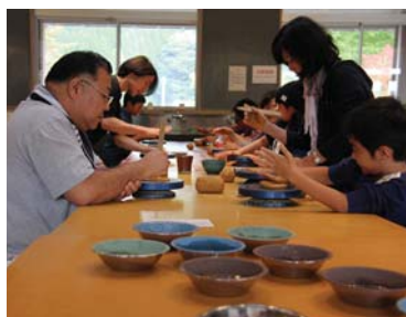
▲伝統産業会館での陶芸体験