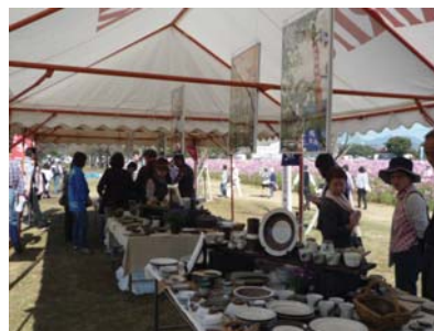
▲小石原焼等の出店の様子

10月3日(土)～11月3日(火・祝)、キリンビール福岡工場横のキリン花園において、キリンコスモスフェスタが開催されました。期間中の10月17日(土)～18日(日)の2日間は、「キリンコスモスフェスタ東峰村 Days」が行われ、東峰村の観光PRブースの設置や七窯土 ななかまど による小石原焼や高取焼、(株)宝珠山ふるさと村の加工品の販売が行われました。会場には、多くの方が訪れ、東峰村を知っていただくことができました。