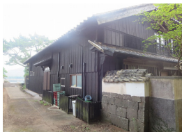
▲古民家レストラン

人口約2,600人(高齢化率約45%)の島である小値賀町では、近年郊外から多くの人に移り住んでおり、その施策について町より説明を受けました。小値賀町では、島全体の観光事業を一本化して提供する組織を立ち上げ、ゲストハウス整備や民泊による中長期滞在型の観光事業の推進、農業分野では担い手会社による後継者育成制度の取り組み、移住者には生活面での制度づくりとワンストップ相談窓口の整備と言った複数のプロジェクトを同時に推進することによって島を活性化させています。今回、特に印象が強かったことは、説明して頂いた総務課の係長が「島全体でヒト、モノを獲得する為に何事もチャレンジして結果を残すことが大事」と話されていたことでした。何かしたらいいなと考えているうちは何も始まらず、とにかく実行しなければ先が見えないということは東峰村でも共通の課題であり、住みたいと思ってもらえるような魅力とは何か、何をすべきなのかを考える上で必要なものを学ぶ視察となりました。