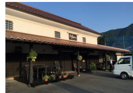
▲A級グルメレストラン「味蔵」