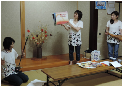
▲エホントのみなさん

“絵本を使って気づきのコミュニケーション 大事な事は全部子どもの絵本に潜んでいる!?”