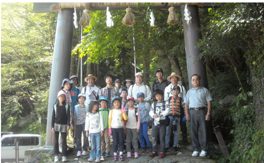
▲出発前の記念撮影

8月8日（土）東峰 Jr. みらい塾は児童10名、大人10名の参加で英彦山登山を行いました。晴天に恵まれ、望雲台からの眺めもすばらしく、頂上でのお弁当も大変美味しく頂きました。児童にも大人にも、きつい登山でしたが、無事に下山することが出来ました。