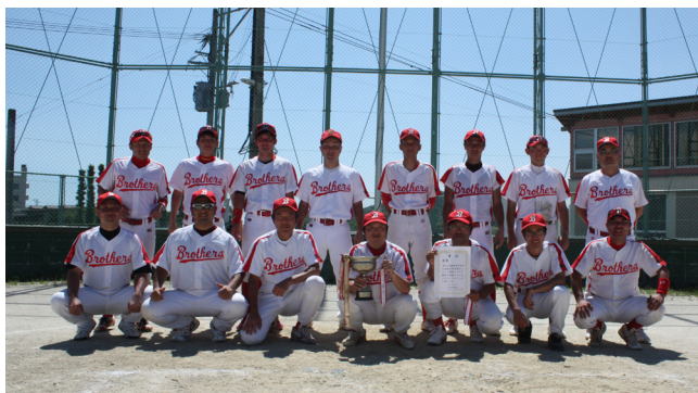
▲軟式野球で優勝した東峰ブラザーズ