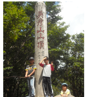
▲英彦山山頂でピース～♪