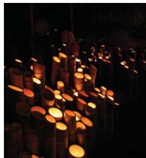
▲炎揺らめく竹灯籠

9月5日(土)、小石原高木神社において、千灯明が行われました。小雨が降るなかでの開催でしたが、住民の方による出店や子ども達による“やまびこ太鼓”の演奏が披露されました。神社の本殿では、神楽の奉納が行われ、多くの人で賑わっていました。