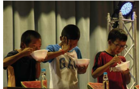
▲あ、頭が… (かき氷 早食いの一コマ)