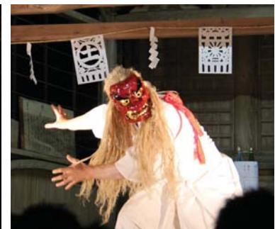
▲奉納された神楽「御輿松の舞」