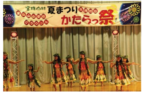
▲ヘレレイプア東峰によるフラダンス