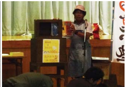
▲わっしょい! わっしょい!