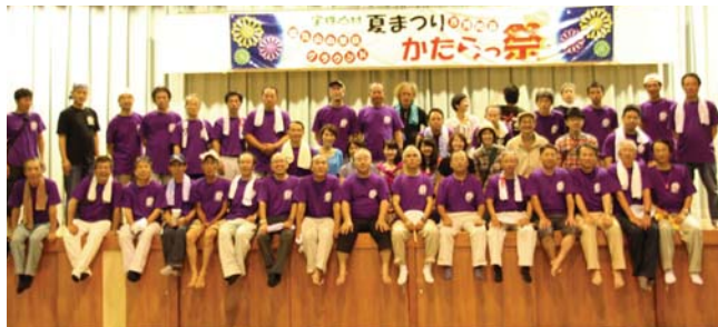
▲かたらっ祭実行委員会のみなさん お疲れさまでした!!

8月15日(土)、村民センターにおいて、第13回かたらっ祭が盛大に行われました。当日は、子どもフラダンスや早食いトライアスロンなどの楽しいステージイベントやメダカすくい、綿菓子などの出店がありました。盆踊りでは、大きな二重の輪になって、子どもから大人まで楽しく踊りました。祭りの最後には、実行委員が工夫した花火が打ち上げられ、小さな村の熱い夜を締めくくりました。