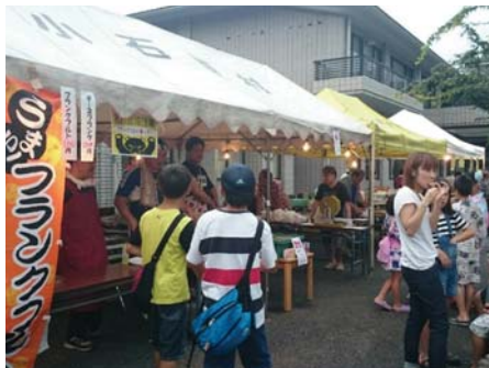
▲明るいうちから賑わう出店