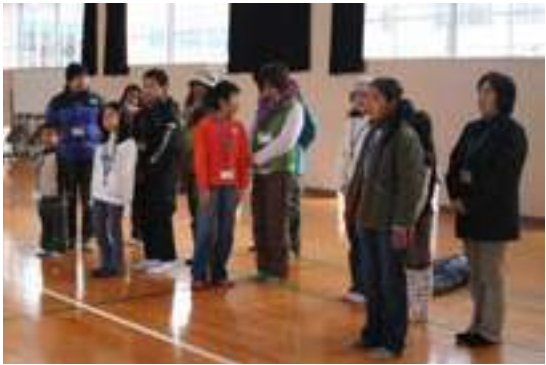
▲体育館での開会式の様子

1月10日(土)、11日(日)の2日間、小石原小学校体育館や喜楽来館などの村内の施設において、小石原山村留学冬の体験会を開催しました。