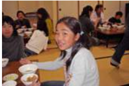
▲みんなで食べたご飯は美味しかったかな?