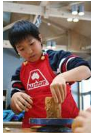
▲陶芸体験も小石原ならでは!