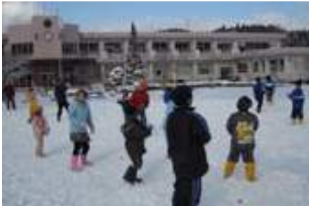
▲大人も子どもも大混戦! 雪合戦大会!!

た。昼食のあとは伝統産業会館で陶芸体験を行いました。今までも冬の体験会は行ってきましたが、今回初めての雪に見舞われました。移動などは大変だったものの、参加者の方たちは一様に「普段生活している中では味わうことができない貴重な体験ができました。」と感想を述べられ、東峰村ならではの素晴らしさを味わっていただけたものと思っています。