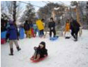
▲大好評のソリ遊び!

当日は現在山村留学中の児童や保護者も含め、23名の参加がありました。鼓の里から会場の小石原小学校までの送迎の車中では、窓から見える一面真っ白な景色に、参加した子どもも保護者も「別世界に来たみたい…」と驚きを隠せない様子でした。会場について開会式を行った後は、小石原アンビシャス広場の子どもたちと保護者の方も含めて雪合