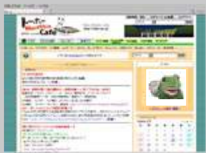
▲トーホー Media Cafe のトップページ

●総務省地上デジタルテレビジョン放送受信相談センター TEL 0570-07-0101 まで