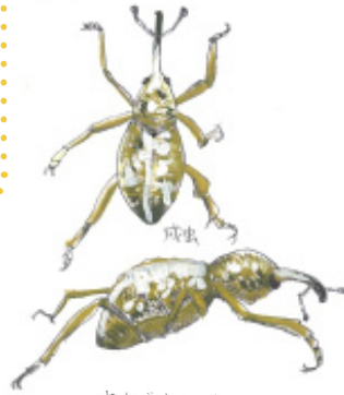
オオゾウムシ (クリ)オゾウムシ