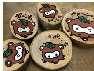
木材アート／アクリル絵の具

「キャンプ場だからこそできること。」そのことを考えていたときに辺りに落ちている木、置いてある木が目につきました。これに絵を描いてみようと思い木材アートを始めました。小さい木材は絵の具を使って絵を描き、木の名前入りプレートは焼き目をつけ描きました。