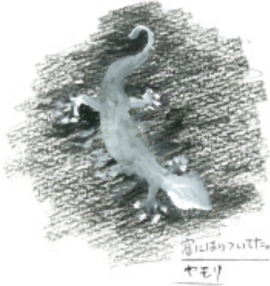
高にほりついでた ヤモリ