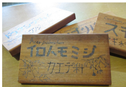
木材アート／ウッドバーニング

「キャンプ場だからこそできること。」そのことを考えていたときに辺りに落ちている木、置いてある木が目につきました。これに絵を描いてみようと思い木材アートを始めました。小さい木材は絵の具を使って絵を描き、木の名前入りプレートは焼き目をつけ描きました。