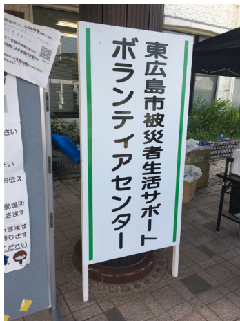
▲東広島市のボランティアセンターにて