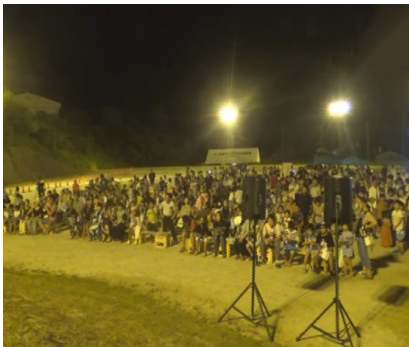
▲集まった大勢の参加者

当日は、地元の方をはじめ、お盆の帰省とも重なり、大勢の子どもと家族が参加し賑わいました。ステージでは、早飲み大会やバンド演奏、抽選会などで大変盛り上がりしました。最後には、近年恒例となった花火も打ち上げられ、夏の夜空を美しく彩りました。