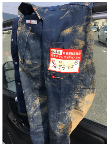
▲泥だらけになった作業着 (東広島市では床下の泥出しを行いました)