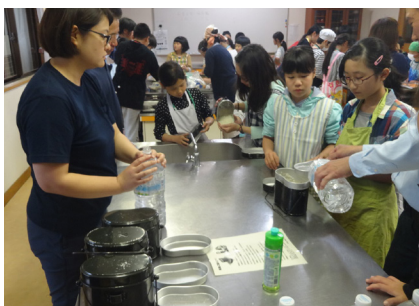
▲ 1日目 (飯盒炊さん)

子どもたちには、日常の生活から離れて、何でも自分たちで行った通学合宿の経験を、これからの生活や人生に自信を持って役立ててほしいと願っています。