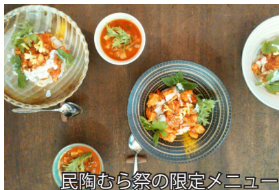
民陶むら祭の限定メニュー

昨年度は、まずは自分を知らせてもらうことが大切だと思い、いろいろな食事イベントを企画して村民の方々にアピールをしてきました。足りないことは多いと思いますが、それでも今年度は食事イベントの企画を縮小したにもかかわらず、より広い範囲で食事の依頼を受けることが出来ました。今年は昨年の災害の関係で復興イベントなどたくさんありましたが、ほぼすべてに参加させていただきました。今後も継続してこのような出張料理を続けていくつもりです。また、直売所で農産加工品の販売も少量ですが開始しました。