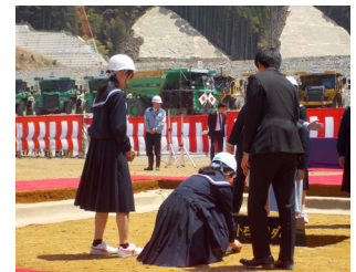
▲メモリアルストーンを 埋納する東峰学園の生徒