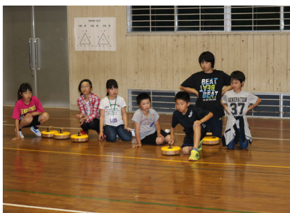
▲ 4日目 (スポーツ交流大会)