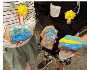
▲願いが込められた メモリアルストーン