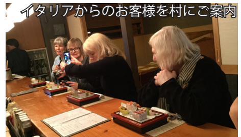
イタリアからのお客様を村にご案内

東峰村に来る前に湯布院にいましたが、いろいろな方と話す機会をいただき、話の中だけです湯布院の過去と現在、過去の栄光と現在の大きな問題点などを感じてきました。同じ過ちを繰り返さぬように、皿山という他にない大きな武器を魅力に変えて東峰村全域の魅力の発信源となればと思っています。