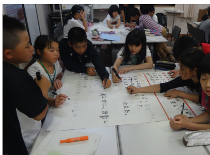
▲ 5日目 (班の報告まとめ)