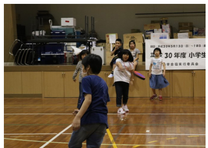
▲ 3日目 (フリー活動)