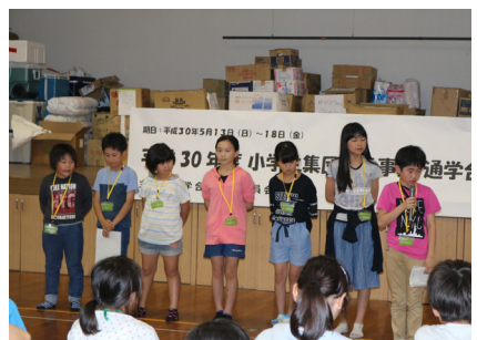
▲ 6日目 (報告会の練習)