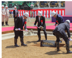
▲定礎行事（鎮定の儀）