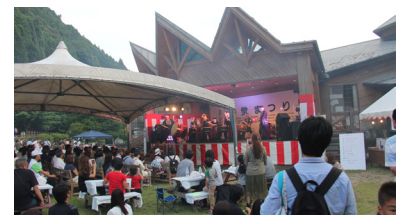
▲ステージイベントの様子