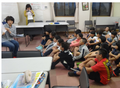
▲ 2日目 (村の民話読み聞かせ)