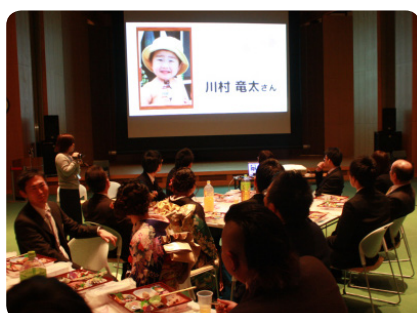
▲「思い出のビデオ」上映