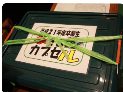
▲思い出のタイムカプセル