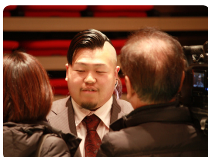
▲テレビ局の取材もありました