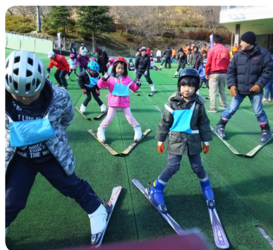
▲みんなで楽しく滑りました