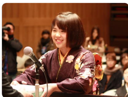
▲記念品が渡されました