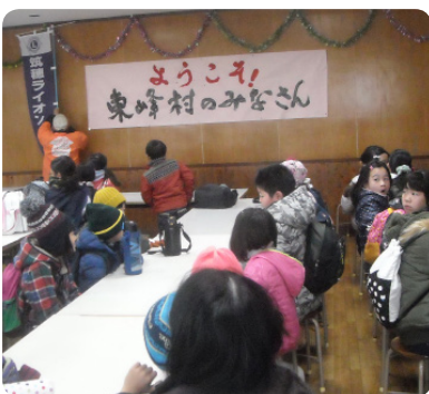
▲ご招待ありがとうございます

12月27日（水）東峰 Jr. みらい塾は、サンビレッジ様のご厚意で人工芝スキーに招待されました。当日は児童30名と保護者含む大人14名の参加があり、子どもたちは初めてのスキーを楽しみました。最初は怖がっていた児童も指導員の方の丁寧な指導のおかげで滑れるようになり、スピードの出し過ぎだと注意するほどでした。児童のためにマイクロバスでの送迎と美味しいカツカレーも用意していただいたサンビレッジ様にはありがたく、貴重な体験の一日でした。今度の豪雨災害ではたくさんの方から多くの支援をいただきましたが、この感謝の気持ちを忘れずに活動していきます。