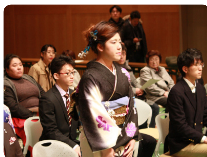
▲成人者紹介の様子