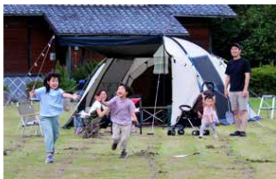
▲皇子原公園テントサイト

神々しい高千穂峰に抱かれた高原町には、古来より守り伝えられている神社や伝統芸能が多くあります。古事記や日本書紀にもある天孫降臨伝説や、初代天皇である神武天皇のご生誕の地としての伝承もあり、訪れる方は、いにしえの文化を感じることができます。