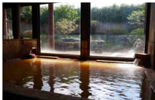
▲奥霧島温泉郷旅館組合 湯之元温泉

春から秋にかけての暖かい時期は、御池の湖面での水上スポーツ SUP（サップ）やカヤック、足漕ぎボートなどの水上アクティビティが人気です。また、霧島連山の主峰である高千穂峰 たかちほのみね の麓には奥霧島温泉郷 ふもと があり、多くの観光客が癒しを求めて訪れます。