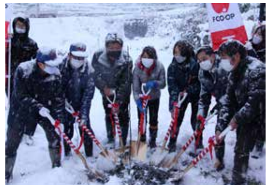
▲りんごの木を前にみんなで植樹する様子

今回の植樹は、東日本大震災に見舞われた福島県と平成29年7月九州北部豪雨災害で被災した東峰村の交流のあかしとして、村内の遊休農地化する棚田を少しでも減らすことを目的に活動している棚田まもり隊と JA 福島との交換植樹で、エフコップ生活協同組合様のご協力により行われたものです。今後福島県へは東峰村のゆずの木を送る予定となっています。