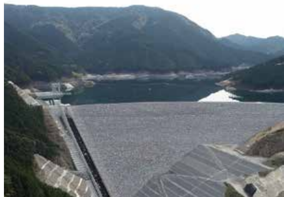
▲建設が完了した小石原川ダム