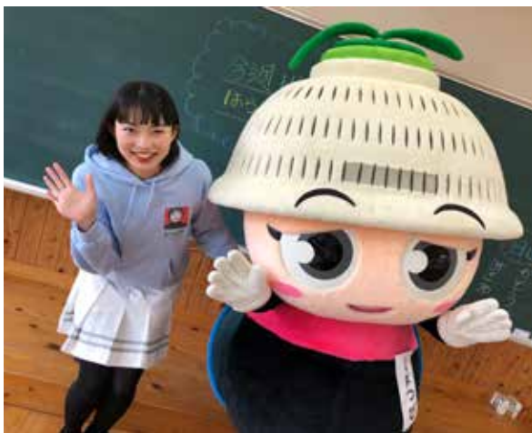
▲アクアクレタ小石原 KBC アイタガール（リポーター）の原さんととほっぴ