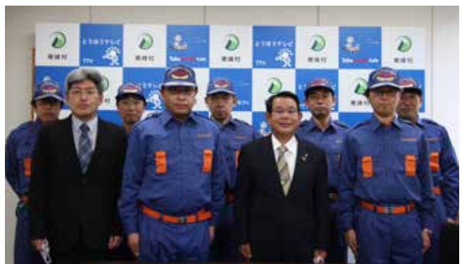
▲新たに発足した役場消防隊

4月2日(金)、東峰村役場消防隊発足式が行われ、9名が任命されました。この組織は役場職員の内、東峰村消防団機能別団員及び一般団員を除く係長以下で構成されており、日中の火災等への早期の対応が期待されます。