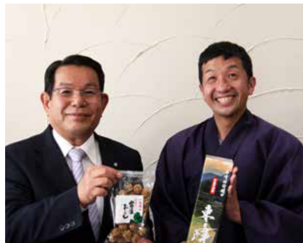
▲村長室を訪れたお笑いタレントの波田陽区さん