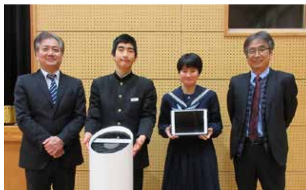
▲整備されたタブレットと空気清浄機

子ども達は「大切に使って、しっかり勉強します。」と力強いお礼の言葉を述べていました。