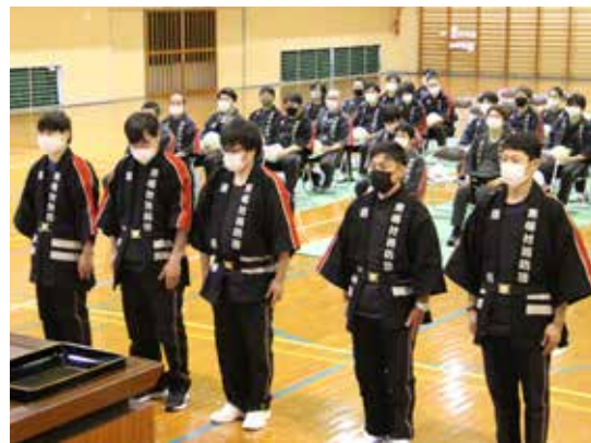
▲新入団員のみなさん (当日出席の5名)