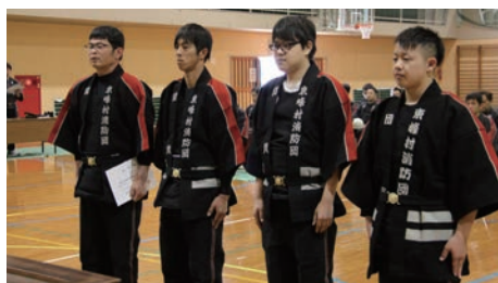
◀新入団員の皆さん（当日出席の4名）