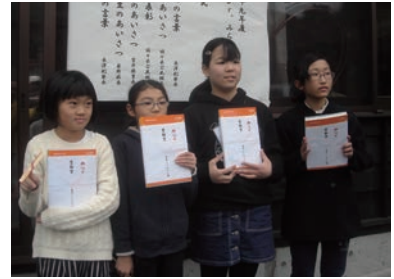
▲皆勤賞、よく頑張りました！