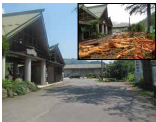
▲ JR 筑前岩屋駅前

平成30年3月に策定した「東峰村復興計画」に基づき、復旧事業に取り組んでいます。現在は、公共災害・林道災害・農地災害等の工事を実施中です。今後は、まだ復旧できていない箇所(主に農地等)の工事を実施していく予定です。