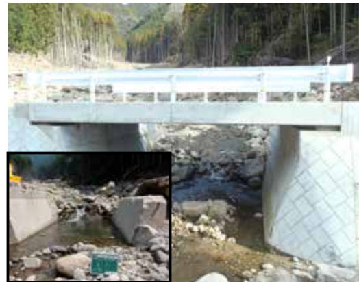
▲林道第 1 屋椎線（屋椎橋）