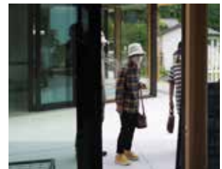
▲里山カフェ「棚田屋」