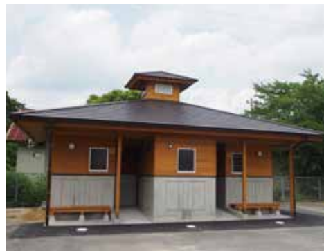
▲宝珠山グラウンドのトイレ