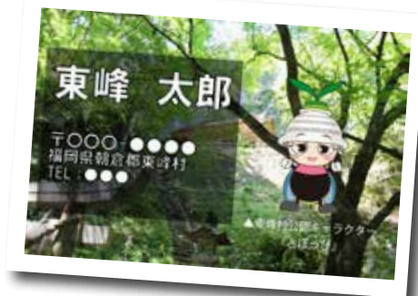
▲『とほっぴ』デザインを活用した事例（名刺）