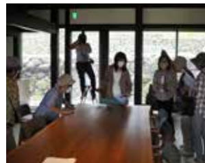
▲古民家ヴィラ「あんたげ」