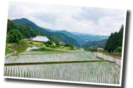
▲日本棚田百選「竹棚田」