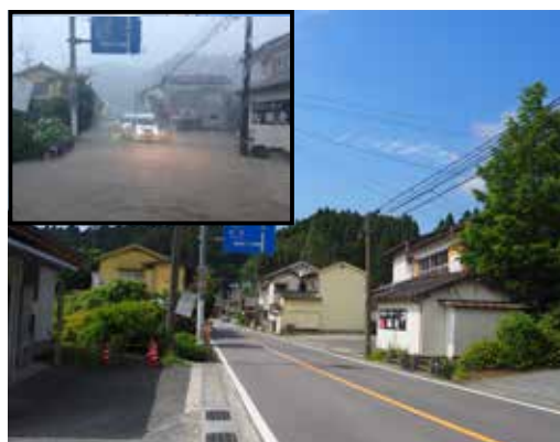
▲ 国道 211 号線 (小石原交差点付近)