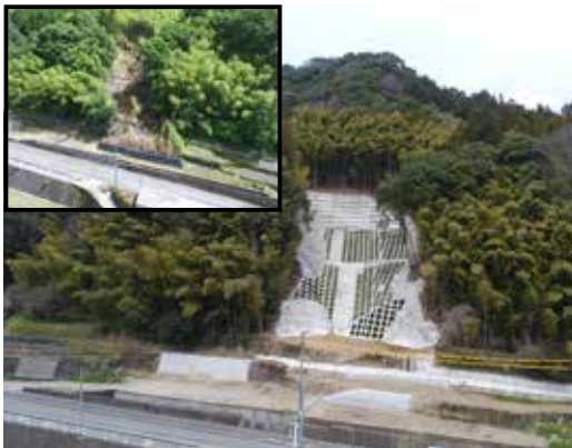
▲国道 211 号線（いずみ館前の道路）