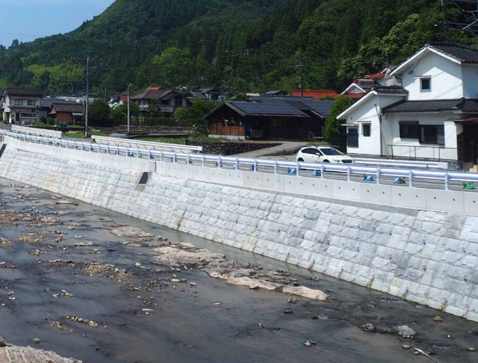
▲延田橋から大肥川上流を望む