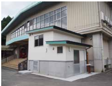
▲村民センターの炊事棟、トイレ

7月も大雨等の災害発生が心配される季節です。避難情報が発令された際は、地区防災マップを確認して安全なルートを選び、地域で定められた避難所をご利用ください。