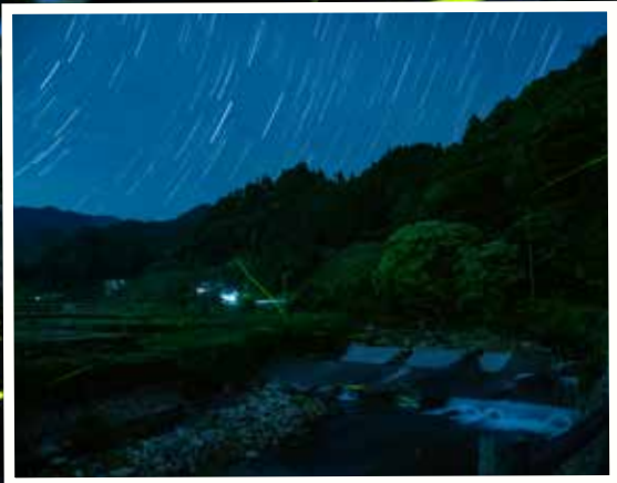
▲棚田親水公園で撮影