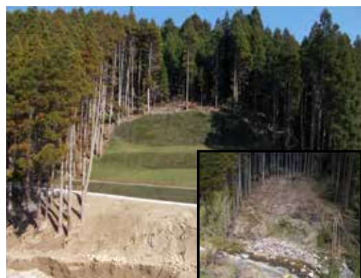
▲辻・久保田線（林道）