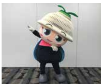
▲エントリーNo.は「195」です！

現在「ゆるキャラグランプリ 2020」でランキング上位を目指して頑張っています。投票はゆるキャラグランプリの公式サイトにアクセスして、ID登録（初回のみ）することで可能になります。ゆるキャラグランプリは、今年が最後の開催となりますので、1日1回の投票をよろしくお願いします！