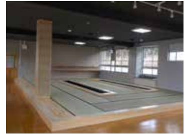
▲囲炉裏の間（旧家庭科室）