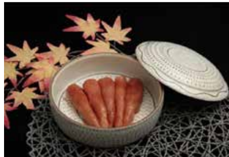
▲コラボ商品「ゆず明太子」