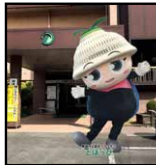
▲AR「とほっぴと一緒に 写真を撮ろう！」