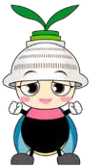
東峰村公認キャラクター とほっぴ

* AR機能とは、スマホやタブレット端末などの機器を使って、CGを現実世界に映し出すことができる技術のことです。代表例には、「ポケモンGO」等があります。