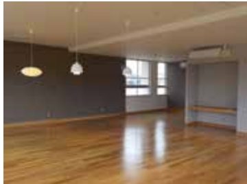
▲スイートルーム（旧音楽室）