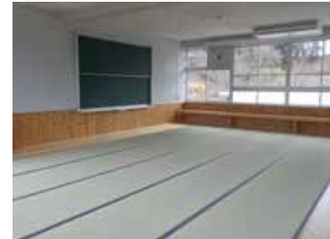
▲多人数部屋（旧理科室）