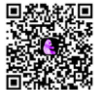
▲無料 AR アプリ ここある 『COCOAR』

また、このサービスは予告無しに終了する場合があります。 (現時点では、2021年3月31日までを予定)