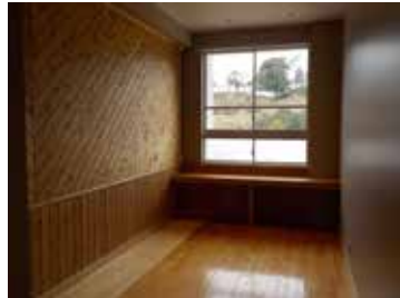
▲シングルルーム（旧図工室）