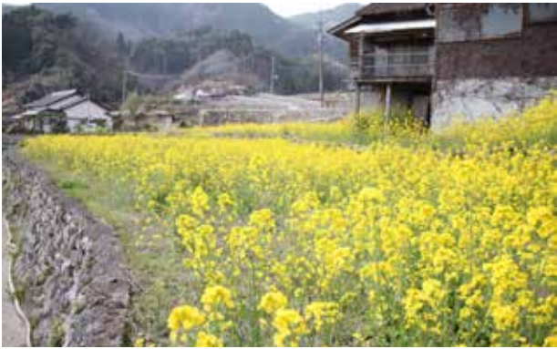
竹棚田に咲く菜の花