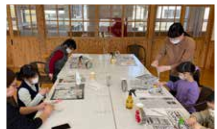
▲ひな人形作りの様子