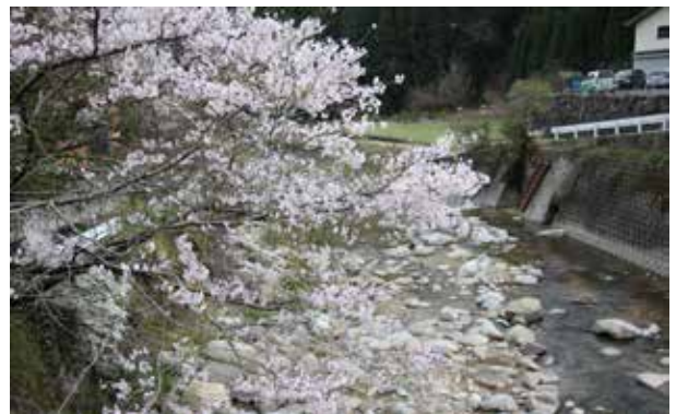
小石原鼓（東地区）の桜