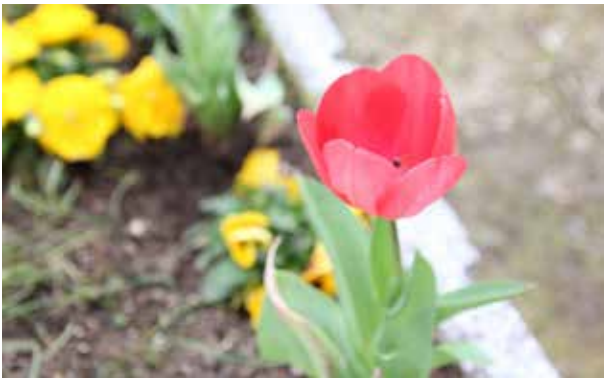
棚田親水公園入口のチューリップ