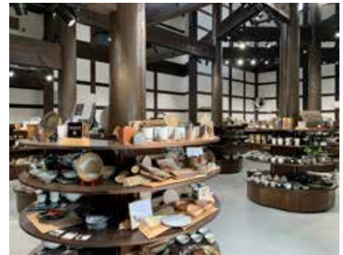
▲道の駅小石原 陶器販売・情報コーナー

今後も村の観光拠点として、村外への情報発信、村内産業への波及効果を期待しています。