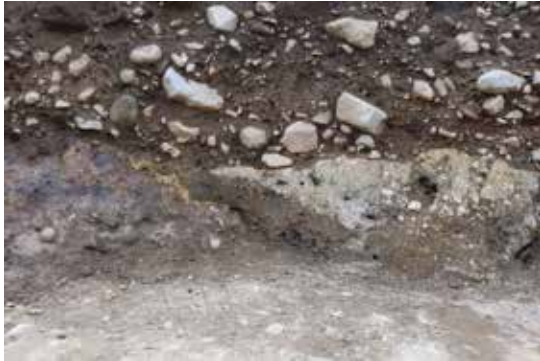
▲阿蘇 4 火砕流堆積物