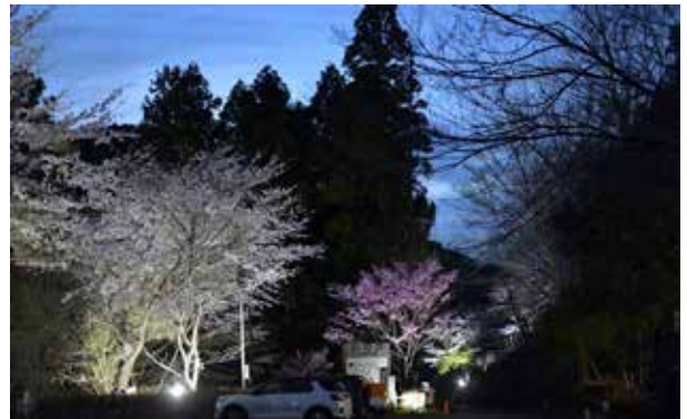
ポーン太の森キャンプ場の夜桜