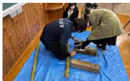
▲ミニ門松作りの様子