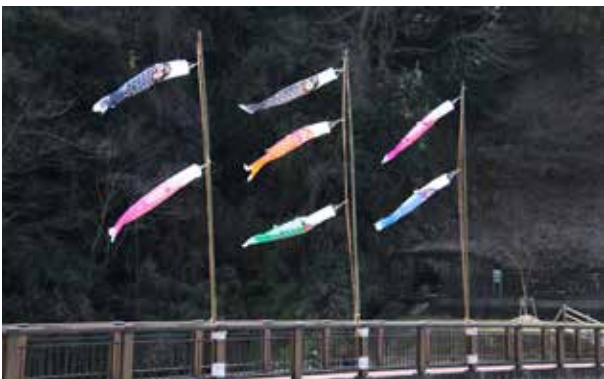
いずみ館裏の橋に設置された鯉のぼり