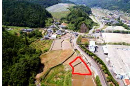
▲指定地空撮（赤枠内）