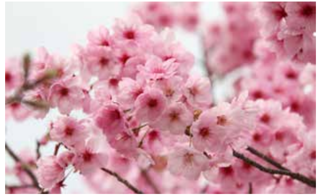
JR 筑前岩屋駅沿線沿いの桜