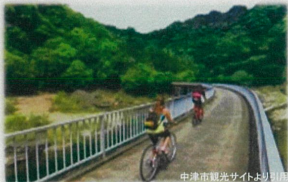
旧耶馬溪鉄道(大分県中津市)