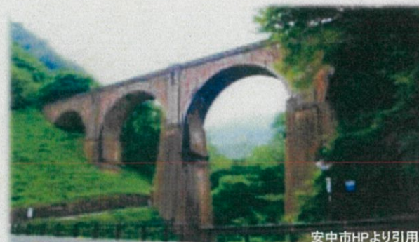
旧国鉄 信越線(群馬県安中市)