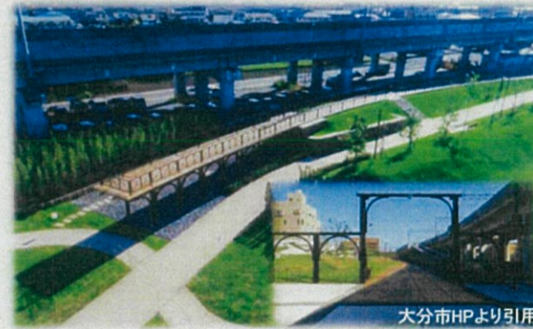
旧日豊本線(大分県大分市)