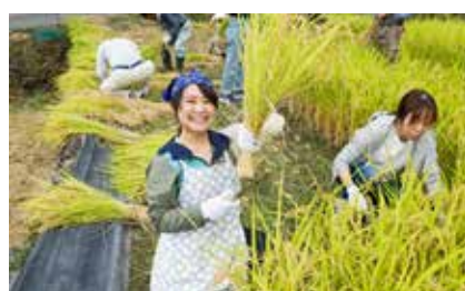
▲稲刈り体験の様子