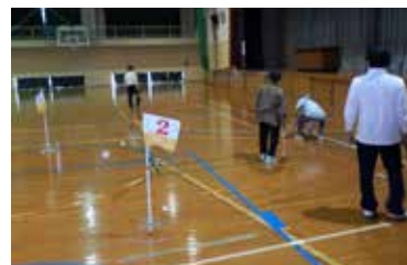
▲グラウンドゴルフの様子

4月25日(月)にニュースポーツ教室を開催しました。5名の方が参加し、屋内グラウンドゴルフで楽しく体を動かしました。今年度から毎月第4月曜日、13時30分から村民センターにて開催しています。