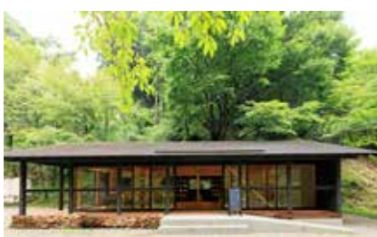
▲岩屋キャンプ場管理棟