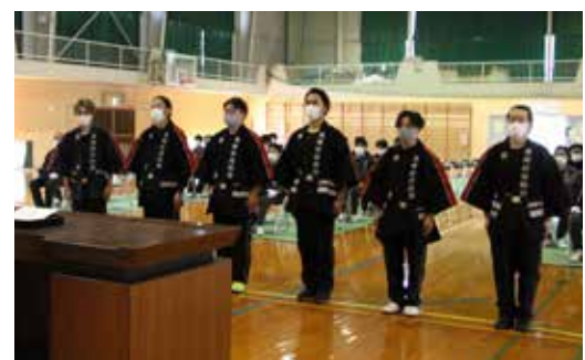
▲新入団員のみなさん (当日出席の 6 名)