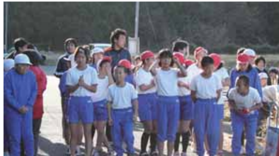
12月10日(木) 宝珠山小学校