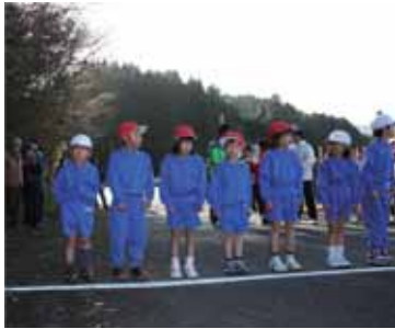
12月3日(木) 小石原小学校