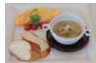
(茄子の トロトロ スープ)