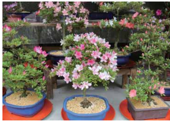
岩下元二さん宅のさつきの花