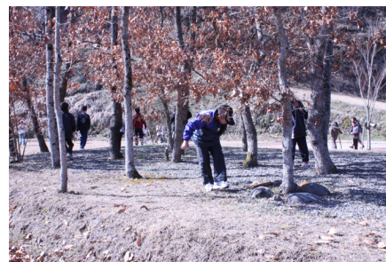
▲宝探しの様子。「当たりはどこかなあ」