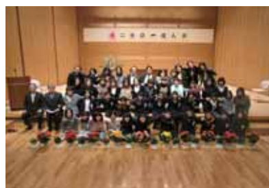
新5年生の集合写真