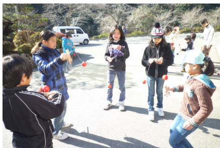
▲みんなでけん玉。誰が1番に入るかな?

閉講式では修了証書と、皆勤賞・がんばったで賞を渡しました。今回の活動で平成22年度は終わりですが、来年度も「東峰 Jr. みらい塾」では様々な体験活動を行いますので、是非参加してください!!