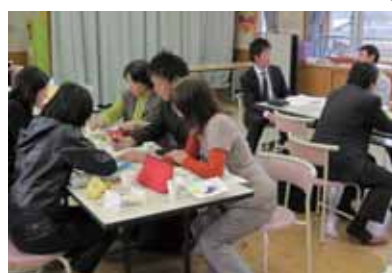
各部でさらによりよいものに