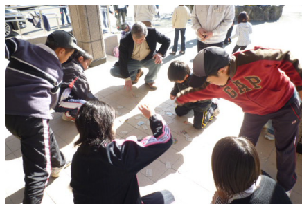
▲こちらは「めんこ」で白熱した闘いが...