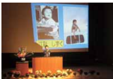
二分の一人式でのスピーチ