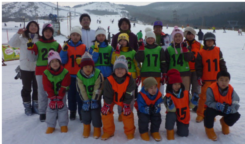
▲ゲレンデをバックに参加者全員で記念写真♪

午後からは、何度もコースにチャレンジする子も見られ、子どもたちの呑み込みの速さに驚きました。帰りには「楽しかった～!」「また来年もスキーしたい!」などの声もたくさん聞かれました。天気にも恵まれ、保護者の方のご協力もあり、ケガや事故もなく、寒さを忘れて元気いっぱい雪山を楽しみました。