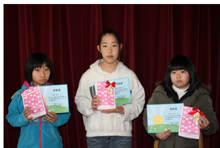
▲皆勤賞の皆さん。1年間ありがとう♪