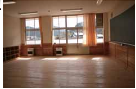
木をふんだんに使った教室