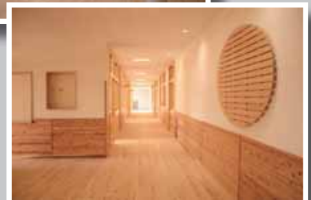
木の香りが漂う廊下