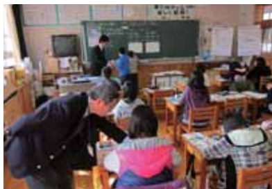
小中の先生2人で指導