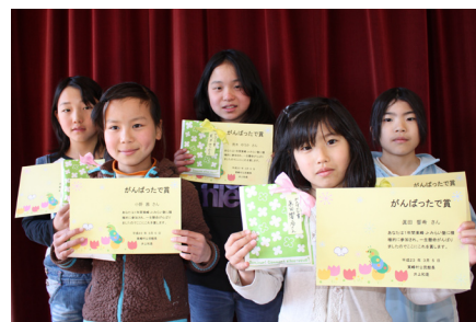
▲がんばったで賞の皆さん。