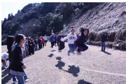
▲縄跳びもみんなで跳ぶと楽しいな♪