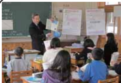
中学校の先生が6年生の算数で

2月9日(水) 小中連携カリキュラムのもとに、中学校の数学の先生が、小石原小学校6年生の算数『図形の拡大と縮小』で授業を行いました。この単元は、今まで中学校で学習していた内容ですが、今年は「移行措置」という取り扱いで、小学校の6年生で学習するようになっています。最後に、小学校算数の内容が中学校数学につながるという話を聞き、小学校での基礎の大切さを改めて感じました。