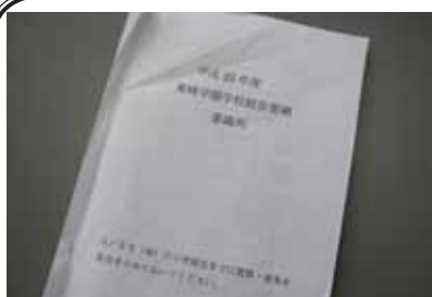
1冊にまとめた教育指導計画

2月25日(金) 東峰村3校の先生たちが集まって小中部会を行いました。小中部会では、昨年度から、研修部や生徒指導部、健康教育部などに分かれて、23年度東峰学園開校に向けて、教育指導計画の話し合いをしてきました。この日は、それぞれの部から出された計画について質問や意見を出し合いました。今回出た質問や意見をもとに、教育指導計画を再度見直し、さらによりよいものに仕上げ、4月の開校に備えたいと思います。