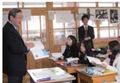
中学校数学とのつながりを説明