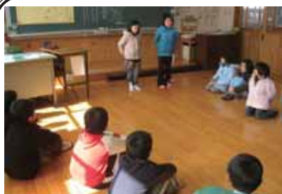
校区の素敵を発表する3年生

2月10日(木)は、4年生がいずみ館で「二分の一人式」を行いました。今まで自分を支えてくださった方への感謝とこれからの目標を堂々と発表する姿に、東峰学園の新5年生としての頼もしさを感じました。