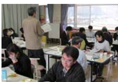
質問や意見の出し合い