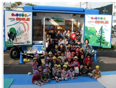
▲キャラバンカー1号車、2号車。今回は2号車が来る予定です。