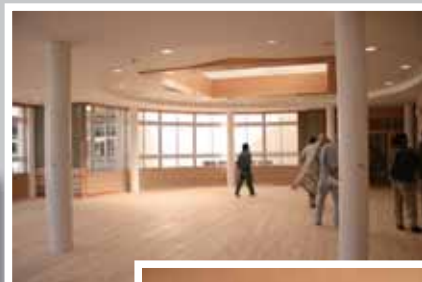
明るいランチルーム