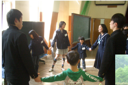
▲宝珠山小、東峰中 対面式

これまでの一貫教育だよりでも紹介していましたが、東峰中学校の改造・増築工事のために、平成22年4月から東峰中学校が宝珠山小学校の校舎に移転しております。この場を借りて、移転後の子どもたちの様子を紹介したいと思います。