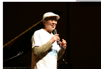
▲ジャズで素敵なコンサートでした。