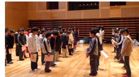
▲ドキドキの初顔合わせ(対面会にて)