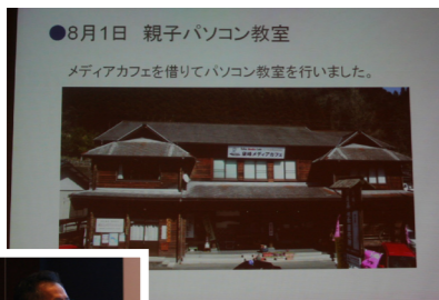
●8月1日 親子パソコン教室 メディアカフェを借りてパソコン教室を行いました。