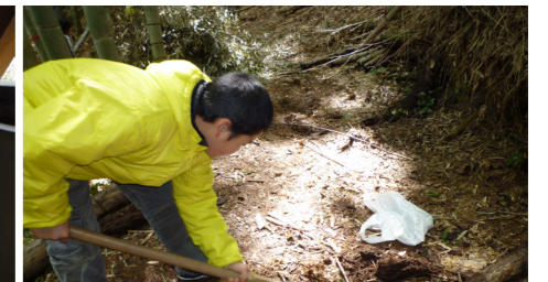
▲タケノコはどこかな? お、発見!!

3月25日、26日に東峰村で宝珠山小学校と福岡市城南区の5年生同士の交流会が行われました。城南区と東峰村(宝珠山地区)の交流は昭和62年8月から始まり、青少年の広域交流事業として、毎年春と夏の2回行っています。今回は宝珠山小学校から13名、城南区の小学校からは29名の参加がありました。