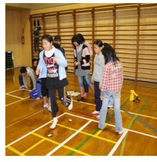
▲結構上手になったよ!

最後に閉講式で、1年間いろいろな体験にチャレンジして頑張ったみんなに修了証を渡しました。今回の活動で平成21年度の活動は終わりですが、来年度も「東峰 Jr. みらい塾」では様々な体験活動を行いますので、是非みなさん参加してください!!