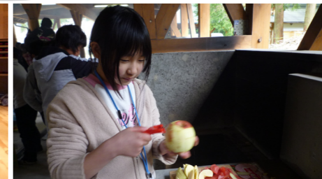
▲ゲットした食材を工夫して使って……