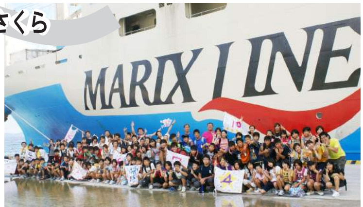
▲乗船する船の前で全員で記念写真！

知覧特攻平和会館やひめゆりの塔での平和学習、環境を考える「サンゴ再生プログラム」の参加、かりゆしビーチでの海洋研修、洞窟探検など盛沢山のスケジュールを元気にこなし、仲間たちとともに有意義な時間を過ごしました。