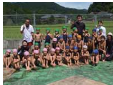
最後にみんなで「ハイポーズ」