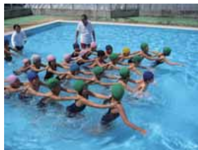
「かもつれっしゃ」で仲良しに