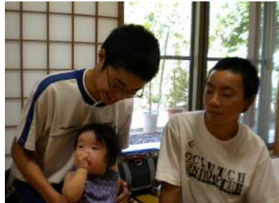
▲良きパパになれそうだね♪