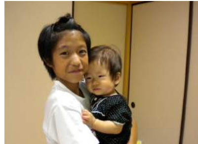
▲赤ちゃん、かわいいなあ♪