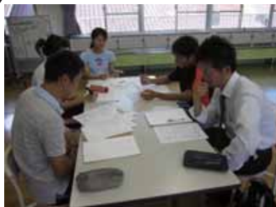
研修部による話し合い

8月20日(金)は、3校で「引っ越し」のための準備をしました。事務部の先生方が作った3校分の備品台帳を片手に、実際に各校の備品を見て回りました。そして、東峰学園に持っていくもの、処分を検討するものなどを仕分けする作業を行いました。