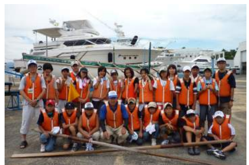
▲カッター乗船体験での1コマ

今回の交流会で子ども達も、様々な体験活動を通して、新たな発見や、チームワークを学ぶことができたのではないのでしょうか。