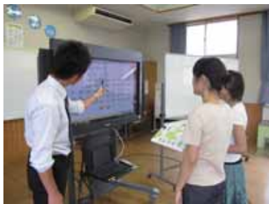
2小での外国語活動研修