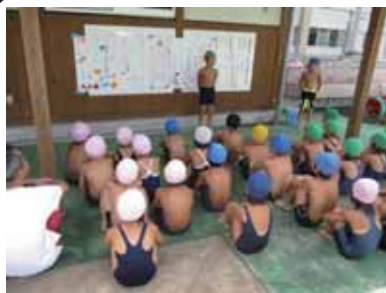
2年生の進行で「はじめの会」

来年の4月には東峰学園で同じクラスになる仲間たちです。お互いの“きずな”が、さらに深まるといいなと思っています。