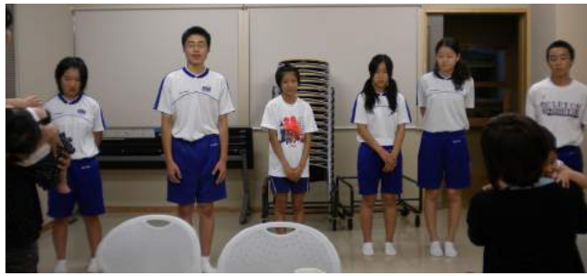
▲今回託児体験をしてくれた6名

お母さん達が別室で学習している間、0歳から3歳までの乳幼児8人を預かりお世話をしました。泣き出した子ども達に自分達も泣きそうになりながらも、それでも辛抱強くあやしたり、習いながらオムツ交換をしたりしました。現在は自分が親になって初めて赤ちゃんを抱くといったことも珍しくなってきました。このような体験を通して育児の楽しさや親の大変さなどを学び、命のことを考えられる人になってほしいと思います。