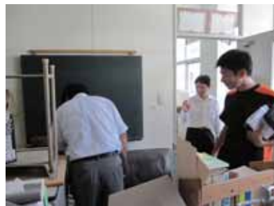
引っ越しのための準備