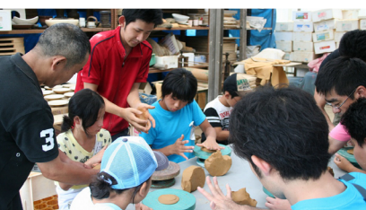
▲初めての陶芸体験♪