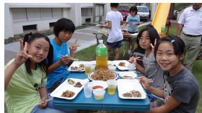
▲学園でみんなとバーベキュー