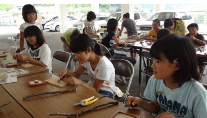
▲ネイチャークラフトの様子