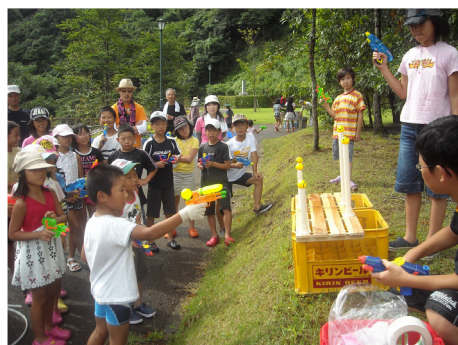
▲水鉄砲での“まとあて”ゲーム