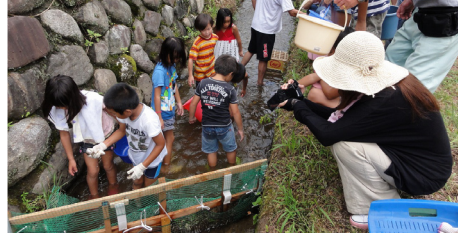
▲用水路を利用して、ヤマメを放流しました