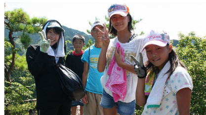
▲岩屋神社での自然観察