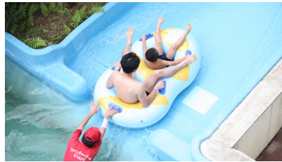
▲浮き輪に乗ってウォータースライダー