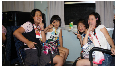
▲帰りの列車でもまだまだ元気！

7月9日(土)に、JR日田彦山線を使ってみらい塾児童32名と保護者、引率の10名で北九州市の志井公園プールへ体験に行きました。当日はちょうど梅雨明けの日と重なり、前日までの雨がウソのように晴れ、絶好のプール日和となりました。