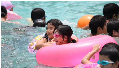
▲波ができるプールが大人気でした！