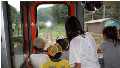
▲列車の旅も良い経験になりました