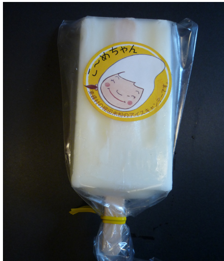
▲米粉アイスクャンデー（1個150円）

それぞれ1個150円で発売中です。村内では、道の駅小石原、村の駅さくら、棚田親水公園、岩屋キャンプ場、(有)しもかわ、諫山商店等で購入することができます。