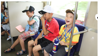
▲行きの様子。列車の中も楽しい♪