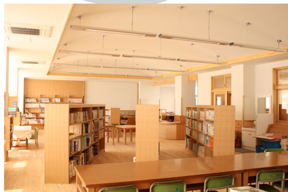
▲広くて明るくなった3Fの図書館内