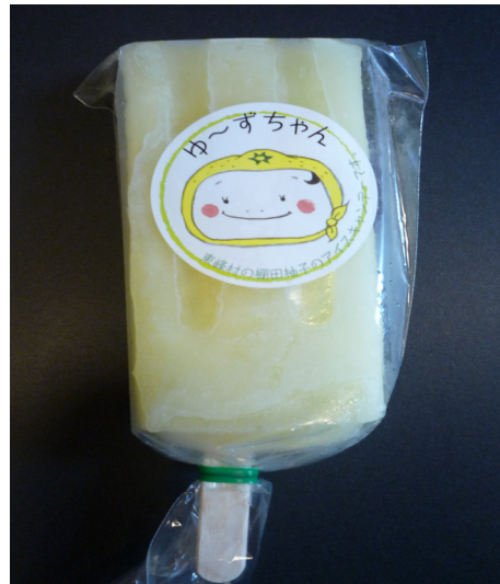
▲ゆずアイスクャンデー（1個150円）