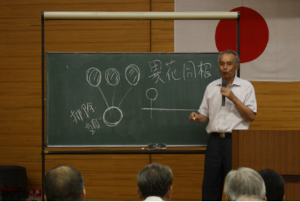
▲“異花同根”…現れる事象は違っても差別の根は同じということを表しています。