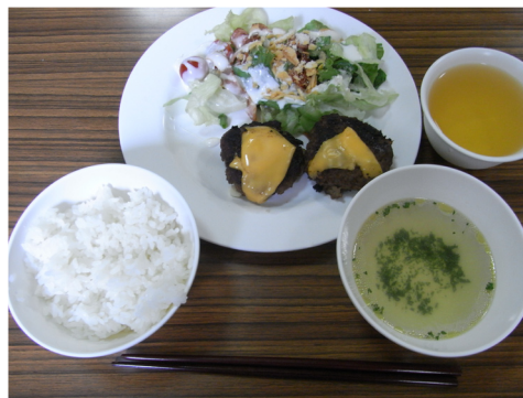
▲じゃ～ん♪ とっても美味しそうでしょ?