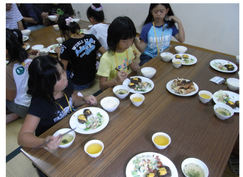
▲やっぱり自分で作った料理は美味しい!