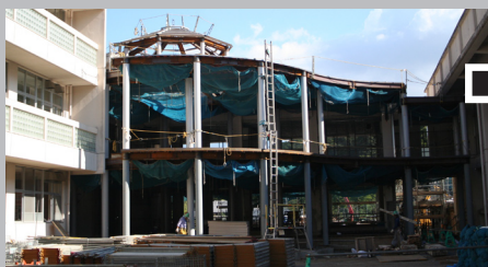
▲中庭からホール棟を望む。円形のホール棟の様子が分かるようになりました。

新設武道場の基礎、増築教室棟の基礎工事が進んでいます。また、ホール棟の鉄骨が立ち上がりました。