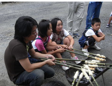
▲炭火でねじねじパンをじっくり焼きます