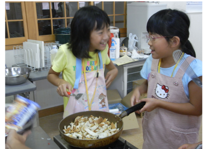
▲こんな感じで大丈夫かなあ?

大人も子ども一緒に楽しみながら調理をし、自分たちの手作り料理の美味しさにとっても満足していました。それぞれに役割を持って活動することや、誰かのために作ることなど、楽しい活動の中で感じられたのではないのでしょうか。是非、お家でもお手伝いを頑張ってくださいね!