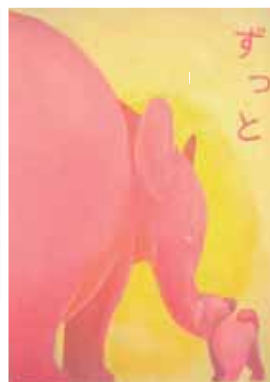
全国高校生ポスターコンクール 教育長賞作品 題「ずっと」(テーマ むすび)