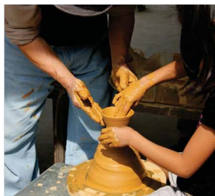
▲伝統工芸士のかたと一緒に