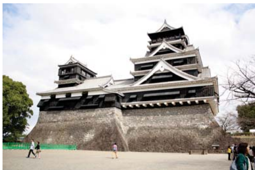
▲小天守閣(左)と大天守閣(右)

また、熊本城クイズウォーキングでは、多くの方がこの謎を解き熊本城を満喫しました。