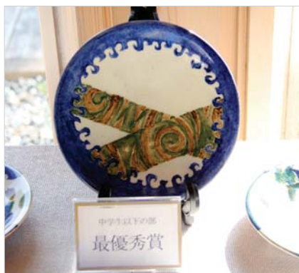
▲絵皿コンテスト作品

道の駅周辺もゆっくりと窯元めぐりをし、秋の農産物を買ってもらえる多くの観光客で賑わっていました。