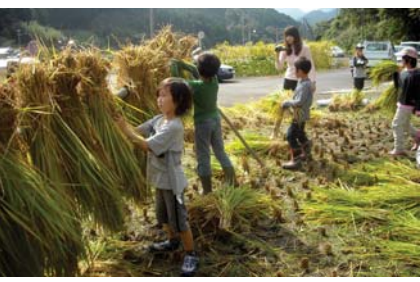
▲稲刈りの後は掛け干し作業!

2時間程の稲刈りでしたが、“きつい”体験が出来たでしょうか。カエルやカマキリを追いかけながらも、最後まであきらめずにやりとげる事が出来ました。採れたもち米は、新年のみらい塾でお餅にして味わいたいと思います。応援頂いた皆様、足場の悪い中での作業ありがとうございました。