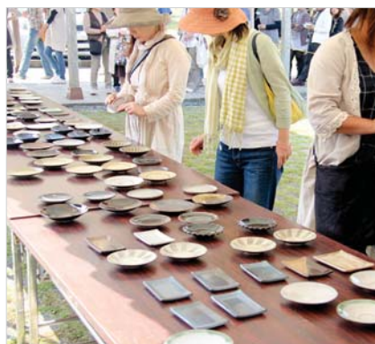
▲小石原焼小皿とおにぎりセット