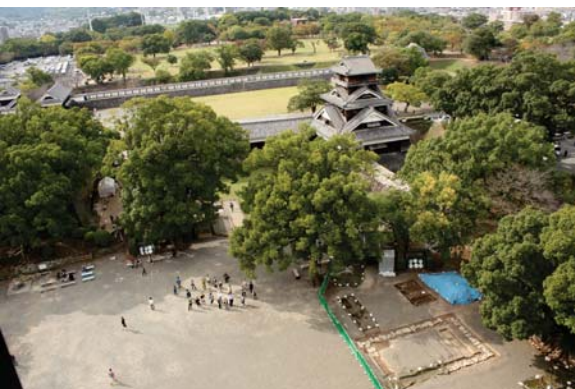
▲大天守閣から宇土櫓(うとやぐら)を望む