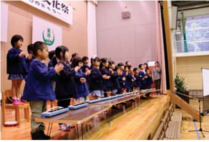
▲美星保育所、小石原保育園の年中・年長児による手話ソング「小さな世界」