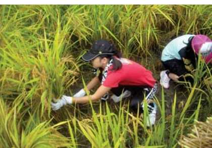
▲一生懸命稲刈りをしました。