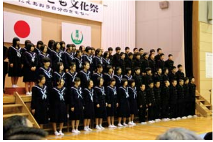
▲東峰学園中学部全員(67名)による合唱「あすという日が」