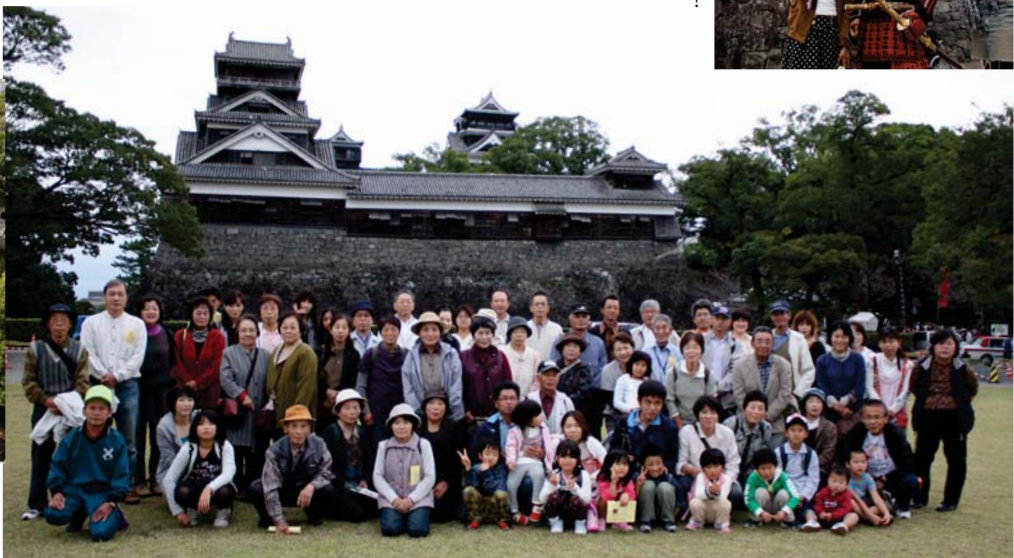
▲参加者全員で記念撮影(一番左は宇土櫓、その右下に隠れて見えるのが小天守閣、さらに右は大天守閣)