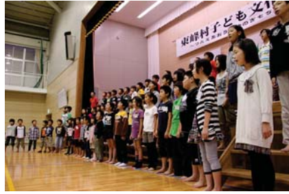
▲東峰学園小学部全員(90名)による合唱「勇気100%」